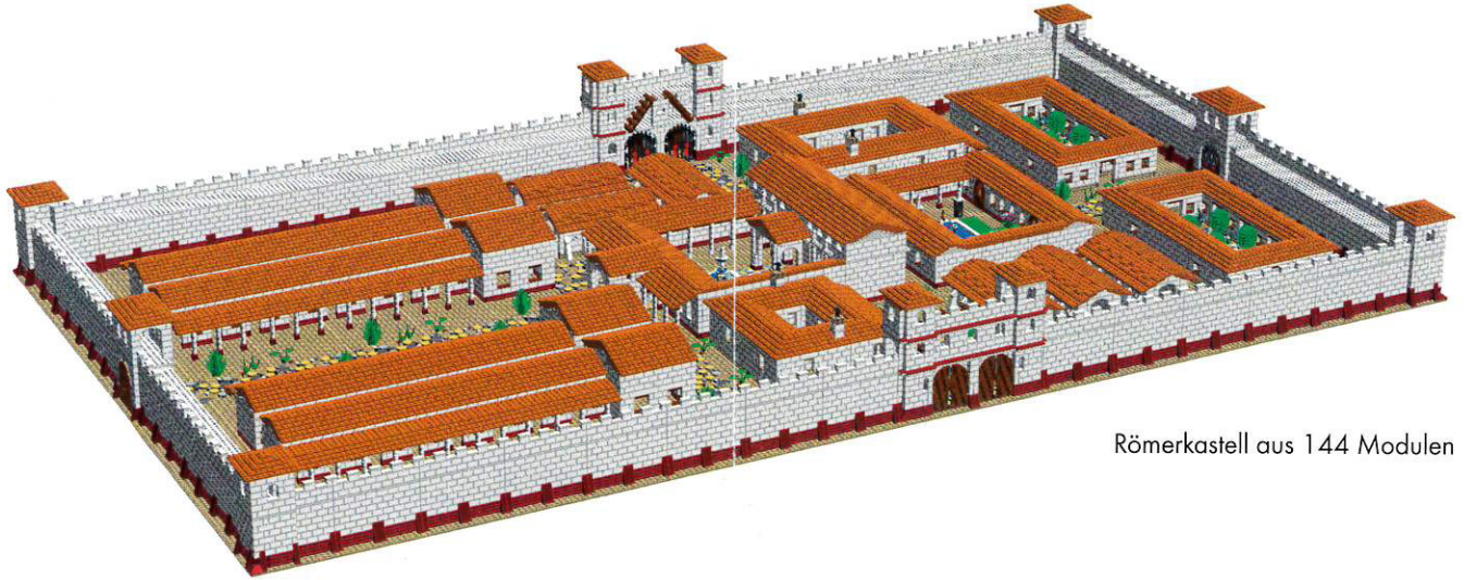
Römerkastell aus 144 Modulen

W er hilft Legus Constructus Plasticus? Der römische Baumeister hat ein Problem. Er soll so schnell wie möglich eine Römerstadt mit Kastell aus 100 000 LEGO®-Steinen errichten.