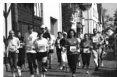
Für Jeden ist beim Römerlauf etwas dabei: Schüler, ambitionierte Läufer und Laufanfänger

Zum VII. Mal läuft der Countdown für das einzigartige Laufspektakel. Ob als Profi, Schüler oder Otto-Normal-Athlet: Wer an diesem Sportereignis teilnimmt, den erwartet eine einzigartige Mischung aus Adrenalin, Ambiente und Spaß an der eigenen Leistung. Besonderes Highlight wird auch 2012 wieder der Lauf über 5.000 Meter sein. Bis Mai konnten sich Firmen, Vereine und Privatpersonen für die Teamwertung melden. Beim Zieleinlauf wird sich zeigen, wer in der Region wirklich die Nase vorn hat.