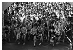
Bald geht es wieder los und die Zuschauer können die packenden Starts der Läufe bewundern.

Mehr Infos: www.roemerlauf-obernburg.de oder http://www.facebook.com/Roemerlauf