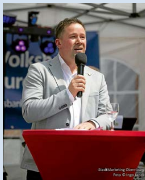
An der ‚Käferplage‘