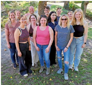
Junger Chor Untitled

Neue Stimmen willkommen beim Chor „Untitled“!