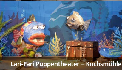
Lari-Fari Puppentheater – Kochsmühle