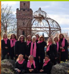
Chor Weiber G'schrey – Anna-Kapelle