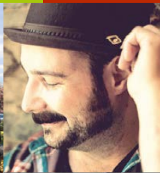
Bogensperger – Kirchplatz