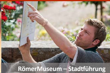
RömerMuseum – Stadtführung