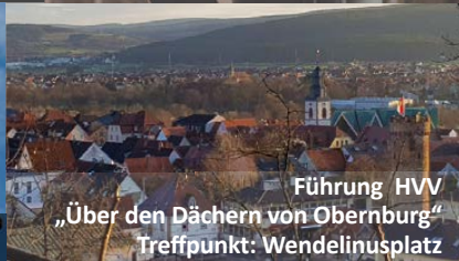
Führung HVV „Über den Dächern von Obernburg“ Treffpunkt: Wendelinusplatz

... außerdem geöffnet vor den Toren der Altstadt