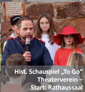
Hist. Schauspiel „To Go“ Theaterverein – Start: Rathaussaal