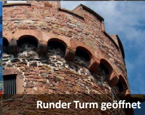
Runder Turm geöffnet