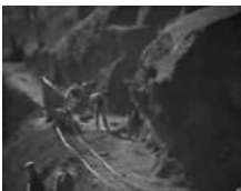
Seltene Bildaufnahmen! Vom Heimat- und Verkehrsverein Obernburg: Bild links: Truppen vor dem Rathaus, Bild rechts: Bau des Franzosenwegs