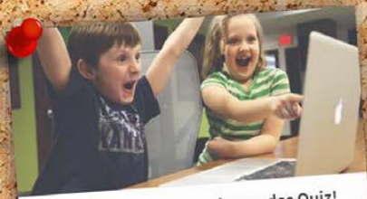
Wie gut kennst du Obernburg - das Quiz!