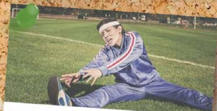
Sport in Obernburg

Ladet euch die medienpädagogische App Actionbound aus dem Appstore runter und erlebt mit der ganzen Familie tolle Rätsel und Rallys in und um Obernburg herum.