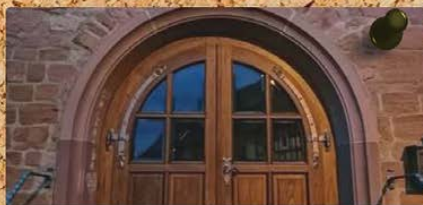
Wie gut kennt ihr Eisenbach?