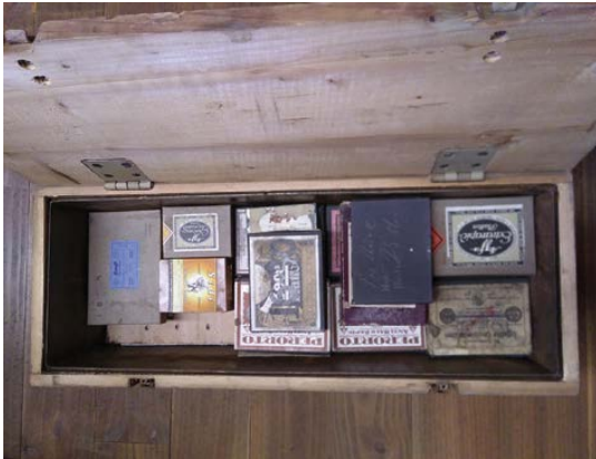
Glasnegative in 31 Originalkartons. Blick in die Kiste mit dem Obernburger Bilderschatz