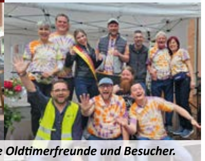
Das KäferPlage-Orga-Team freut sich auf viele Oldtimerfreunde und Besucher.