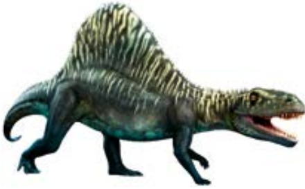
Rekonstruktion des Arizonasaurus