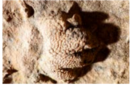
Hand der Richelbacher Saurierfährte – mit Hautschuppen