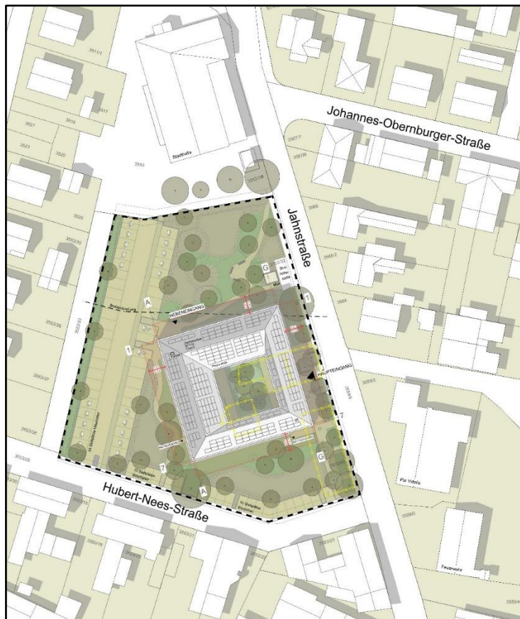
Abbildung 4: Konzeptplan Schwinde Architekten, 27.01.2023