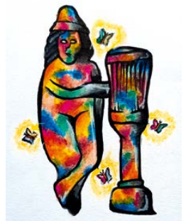
Römischer Gott Apoll, Malwettbewerb 2020

In den Kursen „Kunst trifft Geschichte – Malen/Zeichnen im Römermuseum“ sollen die Ausstellungsstücke des Museums entdeckt und kreativ in eigenen Kunstwerken mit verschiedenen Arbeitsmaterialien aufs Papier gebracht werden.