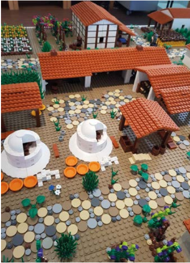
Römisches Lagerdorf mit Töpfereien

Die im Juni beendete Sonderausstellung „Baustelle Römerstadt“ war ein voller Erfolg bei Publikum und Presse. Dies zeigen auch das Besucherbuch des Museums und die Presseberichte,