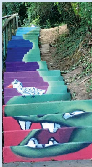
Brunnenstraße, Künstler: Louis Dölle (19 Jahre) zusammen mit Kindern der Ferienspiele

Fünf Treppen wurden bereits aufwendig gestaltet, fünf weitere werden folgen. Ein etwa 4,5 km langer