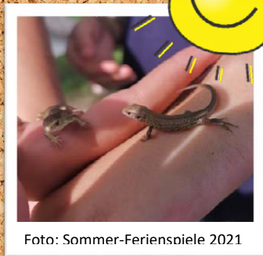
Foto: Sommer-Ferienspiele 2021

„Wald und Natur“ Was verbirgt sich in unseren Wäldern?