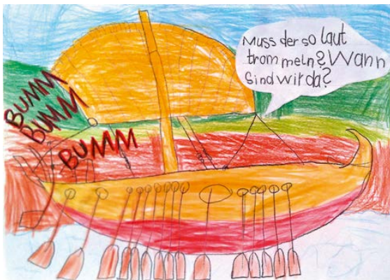
Römerschiff am Mainlimes – aus den Bildergeschichten des Malwettbewerbs. (Künstler*in aus Datenschutzgründen nicht genannt.)

Öffnungszeiten des Römermuseums: Donnerstag bis Sonntag, Feiertage, 14-17 Uhr