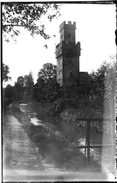
Almosenturm mit Mühlbach