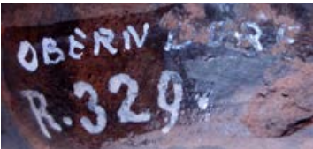
Bezeichnung „Oberndorf“ auf 1849 gefundenen Öllämpchen aus Obernburg