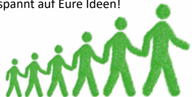
Dietmar Fieger Erster Bürgermeister