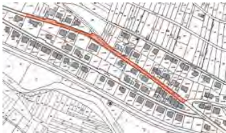
Teilabschnitt - Hardtring 89 bis Hardtring 26

Von Mittwoch 18.04.2018 bis Dienstag 24.04.2018 werden durch die Firma Kutter in Teilabschnitten die Straßendecken mittels einer Dünn-Asphalt-Deckschicht saniert. Betroffen sind der Hardtring, ein Teilabschnitt der Burgunderstraße und der Pflaumheimer Weg.