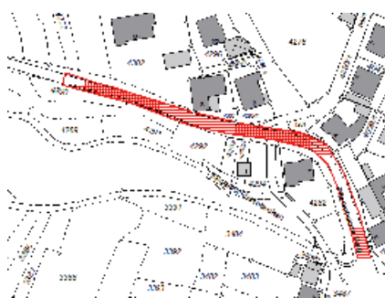
Teilabschnitt - Pflaumheimer Weg 2 bis 8a

Der Ablauf ist wie folgt: Es wird eine Asphaltsschicht über die komplette Breite der bestehenden Straße gezogen. Diese Schicht muss anschließend auskühlen. Während der Herstellung wird der Straßenabschnitt für Autofahrer gesperrt sein. Ein Tag später wird eine zweite Schicht aufgetragen, auch hier wird es zu einer temporären Sperrung kommen.